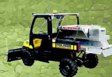
Cabines pour utilitaires, chasse-neiges et épandeurs