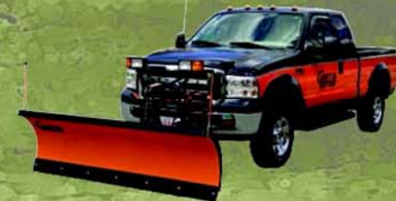
Chasse-neiges et épandeurs pour camionnettes