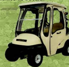
Voiturettes de Golf