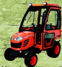
Cabines de tracteur